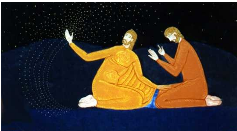
Le pardon des offenses

Ainsi défini, le pardon demeure cependant un acte exceptionnel , qui relève en quelque sorte du miracle . C'est en cela que, selon Ricoeur, la symétrie n'est pas totale entre la promesse et le pardon. Le pardon a une aura religieuse que n'a pas la promesse. C'est pourquoi seule la référence à une justice divine peut donner au pardon son fondement et sa perfection.