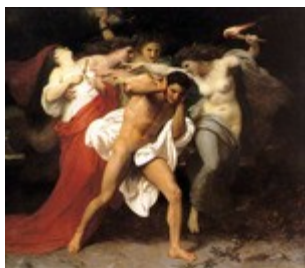
Les Erinyes, déesses de la vengeance

Le problème est celui de la valeur de la justice , de sa prétention à la légitimité . Nous sommes invités, soit à la défense de la justice, soit à sa condamnation . Nous opterons pour sa défense : comment préserver l'acte de justice de sa contamination toujours possible par la vengeance ?