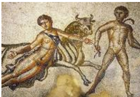
Le châtimeut de la reine Dirce attachée à un taureau mosaïque romaine

On voit donc d'emblée où se situe le rapprochement possible entre justice et vengeance : nous sommes en présence de deux modalités de l' exigence d'expiation . Leur point commun , c'est le châtiment : à un mal subi , on répond par un mal infligé .