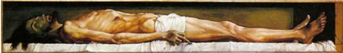
Le Christ mort , Holbein le jeune, Bâle

Le caractère subversif de ce message est bien mis en évidence dans le domaine pictural . « L'histoire mouvementée de la représentation picturale du Christ (...) prouve à elle seule combien le message fut dur à supporter, combien il souleva d'obstacles, combien il bouscula d'interdits, chez les fidèles même qui le transmettaient ». Il fallut attendre en effet la Renaissance pour que les premiers chrétiens osent mettre en scène la crucifixion dans toute sa crudité.