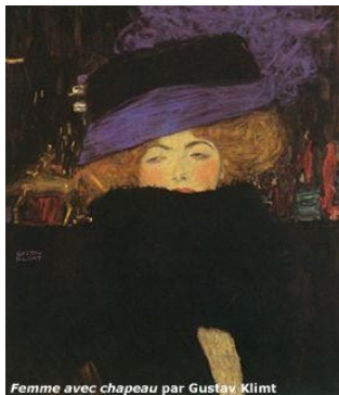
Femme avec chapeau Gustave Klimt

Dans son poème A une passante Baudelaire a su souligner avec force la fugacité et la soudaineté d'une telle rencontre , lorsqu'il entraperçoit une silhouette féminine, «longue, mince» «avec une jambe de statue» , qui disparaît aussitôt dans l'agitation et le chaos de la grande ville. «Un éclair...puis la nuit! – Fugitive beauté / Dont le regard m'a fait soudainement renaître / Ne te verrai-je plus que dans l'éternité?» .