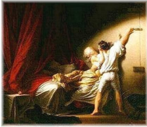
Le Verrou Fragonard