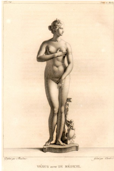
Venus de Médicis

C'est pourquoi la forme artistique idéale apparaît sous l'apparence de la divinité : Zeus, Apollon, Aphrodite, dans la majesté de leur tranquillité bienheureuse , sont les types éternels de l'idéal plastique .