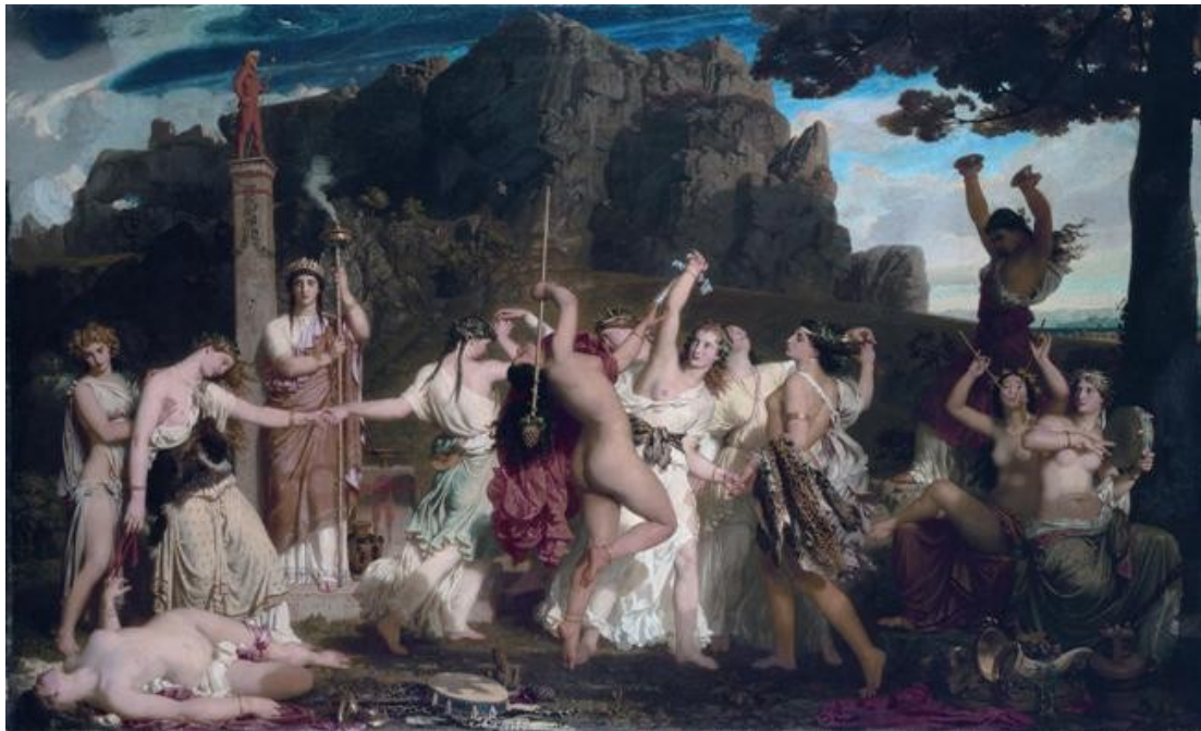
La danse des bacchantes Charles Gleyre

Dans la musique dionysienne dominant la dissonance , la stridence et les rythmes violents . Le chœur exalté des satyres , dans sa surexcitation, renvoie au spectateur de la tragédie l'image d'une bestialité sauvage . Quant au mythe tragique , il met en scène la démensure des luttres titanesques , la toute puissance d'un destin au delà de toute justice, l' impiété de Prométhée ou le crime d'Œdipe. Dans l'art dionysien, la nature, «qui parle d'une voix non déguisée» apparaît ainsi dans toute sa cruauté. Et cependant, en plongeant le regard dans l'horrible, l'homme grec trouve une consolation métaphysique , dans la pensée que la vie , malgré son atrocité , demeure imperturbablement puissante et pleine de joie . «L'art le sauve, et par l'art, – la vie le reconquiert» (par.7). Ce spectacle, en dépit de l'effroi et de la terreur, fait naître en lui l'allégresse et l'enchantement. «L'aiguillon furieux de ces tourments vient nous blesser au moment même où nous nous sommes, en quelque sorte, identifiés à l'incommensurable joie primordiale à l'existence, où nous pressentons, dans l'extase dionysienne, l'immuabilité et l'éternité de cette joie» (par.17). Cette maîtrise artistique de l'horrible a pour nom sublime.