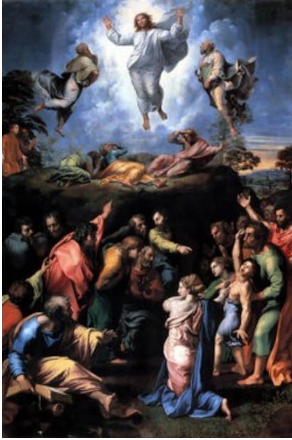
Raphaël La transfiguration

Tel est le véritable sens de l'art pour l'homme grec, seule façon de se protéger de l'horrible démesure de la vie: «car c'est seulement comme phénomène esthétique que peuvent se justifier éternellement l'existence et le monde» (par.5). La belle sérénité grecque n'est pas naturelle, mais durement conquise: elle est la victoire remportée par le monde hellénique, grâce au mirage de la beauté, «sur le mal et la philosophie du mal» .