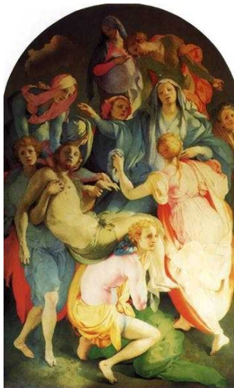
Pontormo La Déposition

Dans son ouvrage Histoire de peintures l'historien de l'art Daniel Arasse explique que « dans le maniérisme, l'attention glisse de quoi, ce qui est représenté, au comment le représenter ». Le choix de l' affectation des formes par la manière , l' artifice , l' exagération , peut alors entraîner la perte du naturel et de la spontanéité . C'est le cas de certains personnages du tableau de Raphaël L'incendie du bourg que le célèbre peintre représente dans des poses totalement artificielles , comme cette canéphore, qui, au milieu de l'agitation et du drame humain qui se déroule, est figurée « portant un jarre sur sa tête » et « marchant avec une très grande élégance ». De même, dans le chef-d'œuvre de Pontormo, La Déposition , le spectateur est frappé par la théâtralité excessive de l' attitude de la Vierge qui « s'effondre en arrière avec un geste d'adieu de la main droite » ou par les poses contorsionnées de Jésus et du disciple qui le soutient.