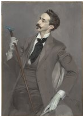
Giovanni Boldini Le comte Robert de Montesquiou