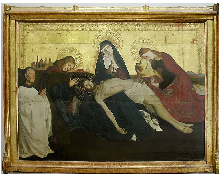
La Pietà d'Avignon Enguerrand Quarton

Cet idéal , fait remarquer François Cheng, est aussi celui de toutes les grandes religions : « on pense – quelle que soit notre conviction ou croyance – au Christ qui (...) a accepté librement de mourir sur la croix. Ce fut là sans doute un des plus « beaux gestes » que l'humanité ait connus ». C'est la beauté d'un tel geste qu'ont tenté de rendre les tableaux représentant la Pietà, si nombreux dans l'art occidental. Parmi eux le monumental tableau connu sous le nom de Pietà d'Avignon , qu'on doit au peintre Enguerrand Quarton. Il s'agit là d'une des représentations les plus impressionnantes de la Pietà. On y voit les larmes de douleur et le désespoir de la Vierge et de Marie-Madeleine, penchées l'une et l'autre sur le cadavre du Crucifié . Et pourtant, quelque chose émane de ce « corps terriblement raidi et cassé », une force qui se met à animer tout le tableau. Car, par ce beau geste qu'a constitué son sacrifice , le Christ a prouvé « que l'amour absolu peut exister et qu'aucun mal ne peut l'altérer ni le souiller ».