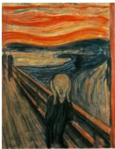
Le cri Munch

Illustrons cette antithèse en comparant les thérapies nouvelles (méthodes et techniques s'appuyant sur un travail psychologique ou corporel), qui jouissent aujourd'hui d'une grande popularité auprès du public, avec les fameux exercices spirituels des Stoïciens: leur but est exactement inverse . Pour les Stoïciens, les exercices visaient à réfréner l'expression des émotions, particulièrement celles qui étaient considérées comme les plus négatives, les plus dangereuses: la colère, la haine, la vengeance. Pour les thérapies d'aujourd'hui, le mot d'ordre est au contraire «libérez vos émotions» . Leur but est de permettre au patient d'exprimer avec le maximum d'intensité des expressions qu'il avait dû jusque là réfréner ou contenir. Il ne s'agit plus de vaincre les émotions et de se défendre contre elles, mais de prendre le risque de les vivre . La décharge émotionnelle devra être brutale et explosive (gesticulations, cris hurlements, larmes...). Ainsi Arthur Janov dans Le cri primal n'hésite pas à dire que même les émotions négatives: la colère, la jalousie, la haine sont bonnes.