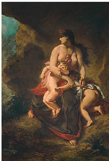
Médée furieuse Eugène Delacroix

Ajoutons à cette définition un deuxième aspect . La passion en effet conjugue une double détermination: à la fois erreur de jugement et impulsion excessive . Elle se caractérise par sa dém mesure , son empor tement : «une indiscipline excessive» . La passion est en ce sens un penchant exagéré .