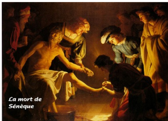
La mort de Sénèque

A la crainte il convient de substituer l'assurance ou la confiance. Confiance en Dieu puisque Dieu prend soin de nous qui sommes ses enfants. Confiance ensuite en la seule chose à laquelle on puisse se fier, c'est à dire notre propre faculté de choisir.