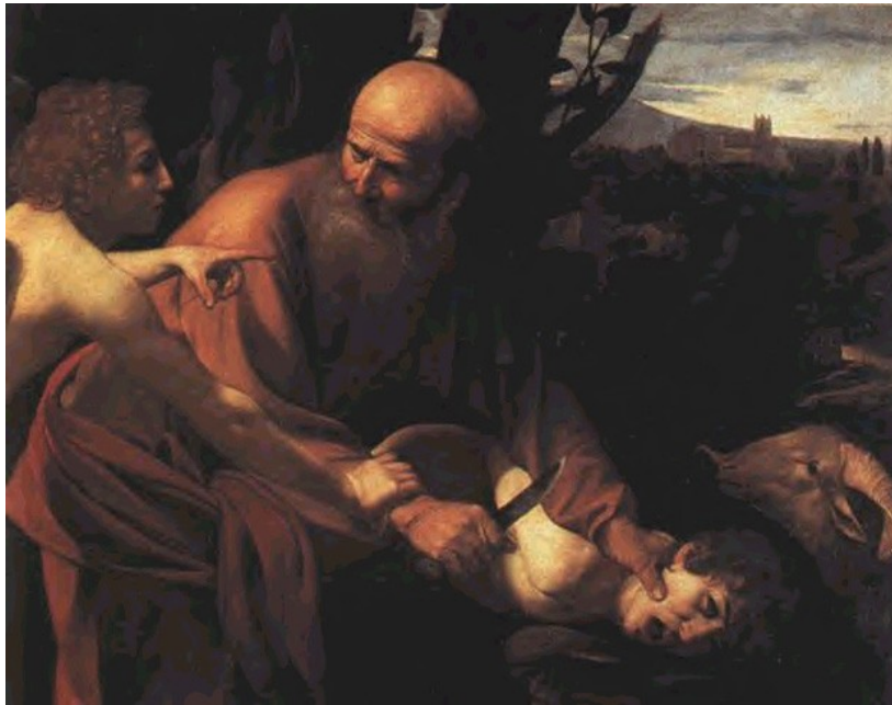
Le sacrifice d'Abraham par

En préférant passer pour un père monstrueux que pour un homme injuste, Abraham représente bien le parangon absolu du Juste.