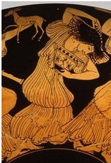
La furor de Médée

Les possibilités d'action de l'individu se trouvent limitées par une puissance qui le dépasse.