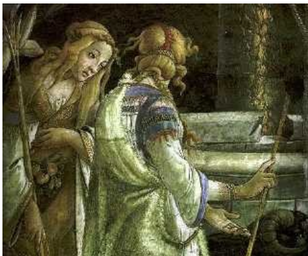
La Zephora de Botticelli

Chez Swann va jouer une cristallisation esthétique (Swann est un esthète, grand amateur d'art). Swann va opérer une association entre le visage d'Odette et celui d'un personnage de Botticelli. A la place de la femme ordinaire, physiquement et psychologiquement décevante, apparaît un chef-d'œuvre de l'art, une pièce de collection. Mais ce n'est que lui-même que Swann retrouve dans cette image, pure reconstruction fictive dans laquelle il a projeté ses propres centres d'intérêt.