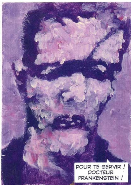
La créature de Frankenstein

Le succès considérable du personnage – qu'illustrent les multiples versions cinématographiques dont il a été l'objet – montre que la science est vécue davantage aujourd'hui comme une source de dangers que comme une source de bienfaits .